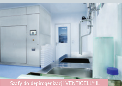
Szafy do deproteinizacji VENTICELL® IL