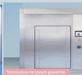
Sterylizatory na gorące powietrze